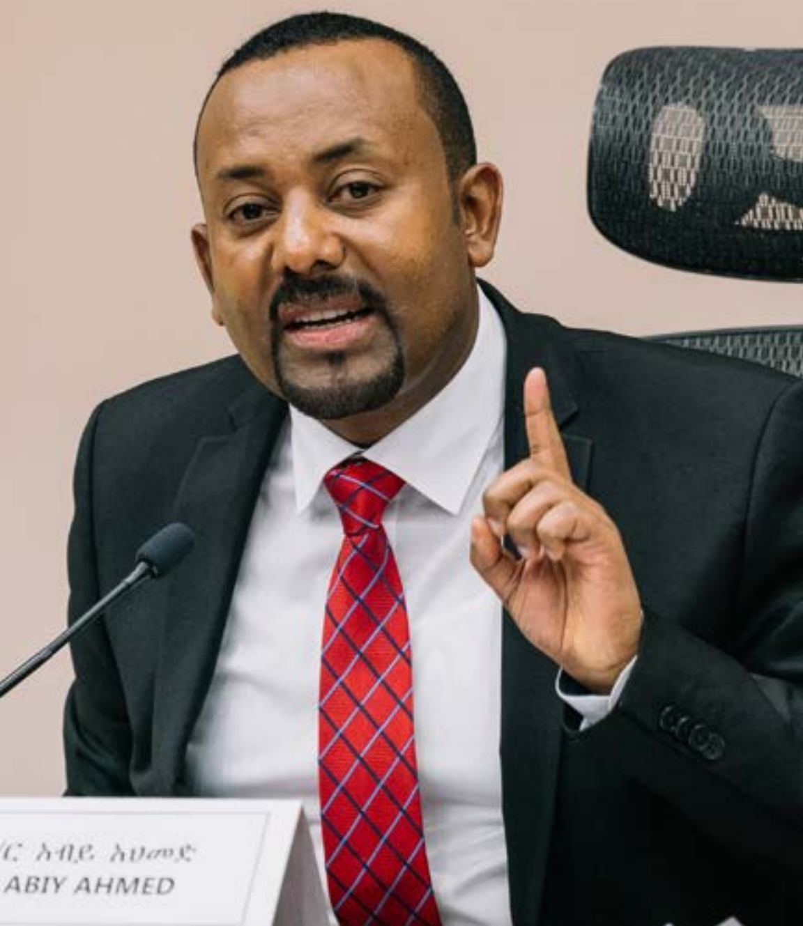
ሪ. አብይ አህመድ ABIY AHMED